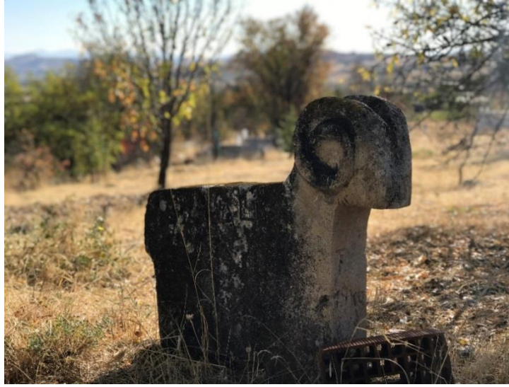
Fotoğraf 5. Pertek-Arpalı Köyü Mezarlığı Koç biçimli mezar taşı formu (Köse, 2021, s. 106).