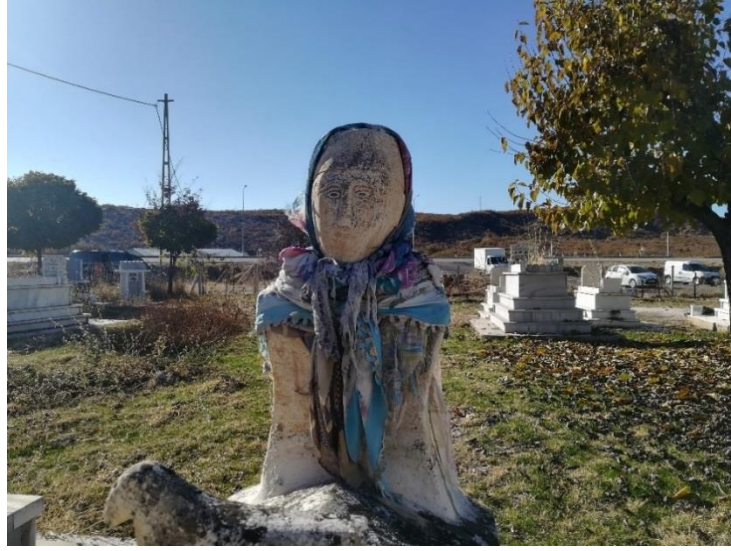
Fotoğraf 3. Tunceli-Merkez Rostan Mezarlığı insan tasvirli mezar taşı, balbal örneği (Köse, 2021, s.103).

Koç-koyun ve At formulu kurgan/mezar kültürünün en önemli örneği Bilge Kağan'ın anıt mezarındaki koç şeklindeki taştır. Yine benzer biçimde Kül Tigin ve Alaşa Kağan anıtlarında da dağ keçisi, koç, koyun motiflerine rastlanır. Bu anıtların çevresinde at formunda taşlara da rastlanır. Millattan önceleri ortaya çıkan ve gelişen, "Avrasya üslubu" olarak isimlendirilen bu gelenek, aynı zamanda "hayvan üslubu olarak da isimlendirilmektedir. Söz konusu hayvan formulu ya da işlemeli taş eserler, bu üslubun örneklerindedir. Türkler bu üslubu Anadolu'ya da taşımışlardır. Tunceli yöresinde geçmişten beri görülen mezar taşı kültürü, bu anlamda somut olarak yaşayan örnekleri oluşturmaktadır (İgit, 2012, s.231).