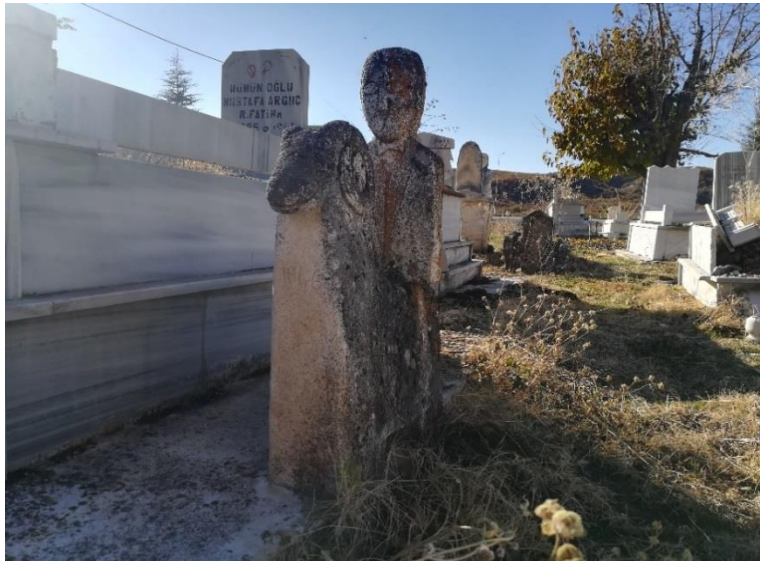
Fotoğraf 7. Tunceli-Merkez Rostan Mezarlığı koç üzerinde insan tasvirli mezar taşı, balbal örneği (Köse, 2021, s. 107).