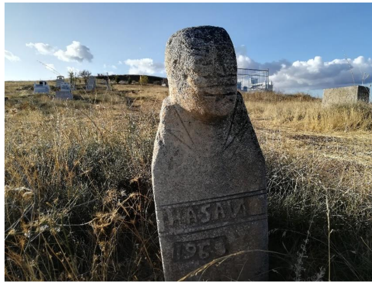
Fotoğraf 2. Pertek-Pirinççi Köyü Mezarlığı insan tasvirli mezar taşı, balbal örneği (Köse, 2021, s.102).