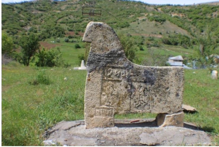
Fotoğraf 6. Pertek-Kayabağ Köyü'nde bulunan, üzerinde ölen kişinin avcı olduğunu betimleyen bir kabartmaya ve birbirine sarılmış iki insan kabartmasına sahip, koç biçimli mezar taşı (Köse, 2021, s. 106).