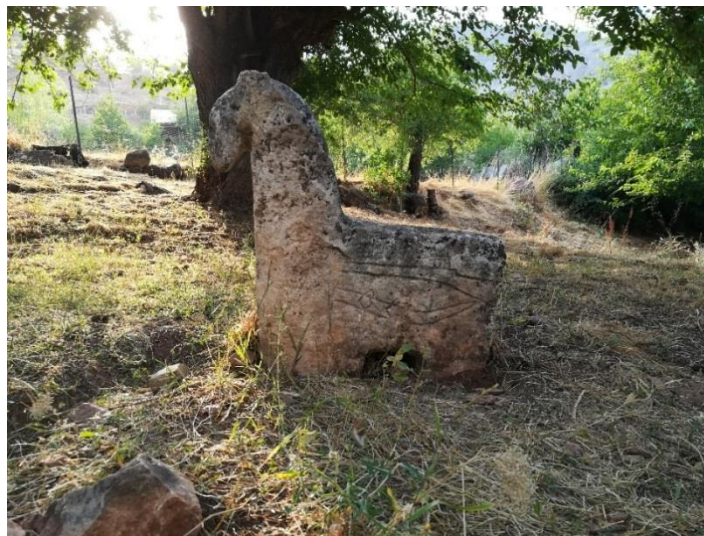
Fotoğraf 4. Tunceli-Merkez Rabat Köyü’nde bulunan, üzerinde hançer ve tüfek kabartmaları bulunan, at biçimli mezar taşı (Köse, 2021, s. 105).

İldeki tüm ilçelerde ve pek çok köyde, koç, koyun, at ve insan formlu mezar taşı örneklerine rastlanmaktadır. Örnek vermek gerekirse, koç/koyun formlu eserlerin toplu olarak yer aldığı köylerden birisi Pülümür Sağlamtaş köyüdür. Köyde 12 tane koç/koyun formlu mezar taşı bulunmaktadır (İğit, 2012, s. 199). Pertek ilçesi sınırlarındaki Koçpınar köyü, hali hazırda birkaç koç/koyun formlu taşla sahipse de geçmişte benzer mahiyette pek çok esere sahip olduğu bilinmektedir. Bu köydeki eserlerin 1980’li yıllarda çeşitli müzelere sergilenmek amacıyla gönderilmesi söz konusu olmuştur (Tekinoğlu ve Törne, 2018, s. 66). Yapmış olduğumuz saha araştırması esnasında Pertek Kayabağ, Arpalı, Pirinççi Köyü, Tunceli Merkez Rabat Köyü, Atatürk Mahallesi Rostan Mezarlığı gibi yerlerde, koç, koyun, at ve balbal formlu mezar taşlarını tespit etme imkânı bulduk. Yöre halkından edinilen bilgilerle bu eserlerin eskilerde daha da yaygın bir şekilde görüldüğü anlaşılmıştır. Mezar taşlarının pek çoğunun ne yazık ki define vb. arayışlarla tahrip edilmesi söz konusu olmuştur. Bu durum yöre genelindeki benzer mahiyetteki taş eserlerin geneli için geçerlidir.