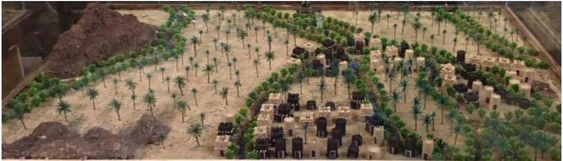
Resim 1: Yahudilerin şehre ilk yerleşimlerini gösteren bir minyatür (Medîne şehir müzesinden)

Amâlîkadan sonra Yahudilerin bir kısmı Teyma'ya bir kısmı Hayber'e bir kısmı da Yesrib'e yerleşmiştir. Böylece Yesrib toprakları ilk kez Yahudilerle buluşmuştur (İbn Zebâle, 2003, 167-168; İbn Neccâr, ts., 26-27; Ahmed Emîn, I, 1928, 27). Tarih noktasında kesin bilgi olmamakla beraber Yahudiler şehre yerleştikten sonra başta bölgenin en verimli kısımları olmak hemen hemen tamamına hâkim olmuşlardır. Özellikle de Mehzûr, Müzeynib, Buthân gibi şehrin en sulak ve en verimli bölgelerini, sâfile, harre, Kuff, Zeğâbe'ye yakın yerleri tercih etmişlerdir. Mesela Kurayza Yahudileri Mehzûr ovasına, Nadîr Yahudileri Müzeynib ovasına, Kaynuka Yahudileri ise Buthân vadisinin olduğu köprü taraflarına yerleşmiş, kuyular açıp bahçeler ekmişlerdir. Kendilerine hem oturacak evler hem de korunacak kaleler (utum) inşa etmişlerdir. Bu sayının da 59 olduğu söylenmektedir (Bekrî, I, 1992, 413-414; Mercânî, I, 2002, 136; Yâkut Hamevî, V, 1995, 84; İbnü'z-Ziyâ, I, 1997, 216; Nehrevâlî, 1997, 15; Ayyâşî, 1972, 17-18). Buraya göç etme hususunda en önemli rol Kaynukalılara ait olmalıdır ki hemen şehrin batı kısmında "kaynuka" adında bir pazar kurmuşlardır. Bu sebeple daha sonra Araplardan bazı gruplar buraya gelmiş ve Yahudilerin yanında kalmaya başlamışlardır (İbn Zebâle, 2003, 169; Mercânî, I, 2002, 136; Nehrevâlî, 1997, 15; Cevâd Alî, VII, 2001, 129; Ğadbân, 1993, 84).