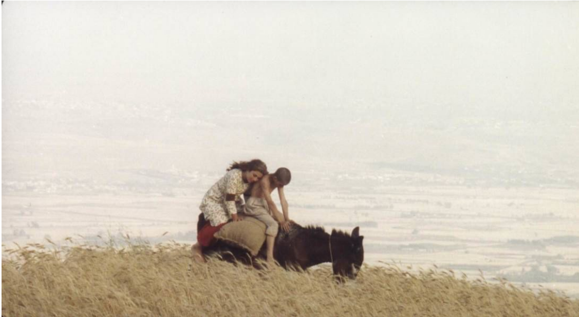
Sunduq Al-dunya / Fedakarlıklar (2002) (Yön. Ossama Mohammed)†

Ossama Mohammed’in Nudjum al-Nahar / Gündüz Vakti Yıldızlar (1988) ve Sunduq Al’dunya / Fedakarlıklar (2002) filmleri ile Abdellatif Abdul-Hamid’in Layali Ibn Awa / Çakal Geceleri (1988) ve Rassalle Chafahyia / Sözlü Mektuplar (1991) filmlerinde toplumun çekirdeği aileyi görmek mümkün olmaktadır ve bunlarda ataerkil düzende gücü elinde tutan baba, dede ya da büyük ağabeyin eleştirisi aynı zamanda katı rejimin eleştirisi olarak karşımıza çıkmaktadır. Nudjum al-Nahar / Gündüz Vakti Yıldızlar (1988) filminde evin reisi ile Esad’ın benzerliği tartışılmayacak kadar açıktır. Çakal Geceleri (1988) ve Sözlü Mektuplar (1991) filmlerinde aile reisinin ordu bağlantısı ve ailesine karşı katı otoriter tutumu askeri kamplardaki disiplini akla getirmektedir. 1990’lardan Suriye’deki savaşa kadar Sunduq Al-dunya / Fedakarlıklar (2002) (Yön. Ossama Mohammed), Taht Al-Sakf (2005) (Yön. Nidal Debs), Al-layl Al-tawell (2009) (Yön. Hatem Ali) ve Dimasqhq Ma’a Hobee (2010) (Yön. Mohamad Abdulaziz) gibi filmler uluslararası festivallerde önemli başarılar elde etmiş ve ödüllerle dönmüşlerdir.