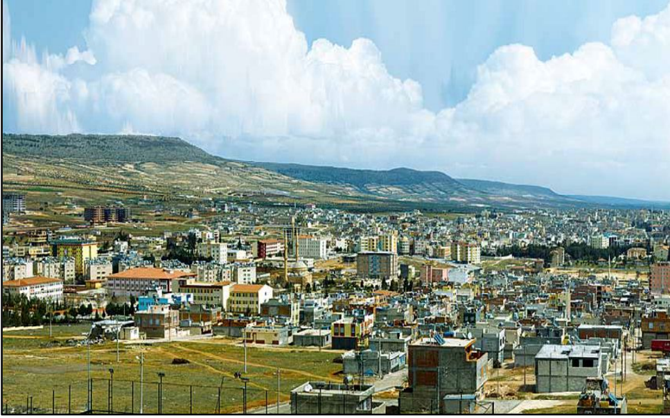
Foto 1: Birçok şehrimizde olduğu gibi Kilis'te de çarpık kentleşme çeşitli sorunların ortaya çıkmasına sebep olmaktadır.

açmaktadır. Doğal ve kültürel değerlere verilen zarar, çarpık kentleşme, ulaşım, eğitim, sağlık, barınma, güvenlik, çevre kirliliği, alt yapı ve doğal afet riski bu sorunların ilk akla gelenleridir (Çelik, 2019, 314). Kilis'te kontrolsüz ve gelişigüzel yayılan şehirleşme, önemli sorunlara yol açan çarpık kentleşme görüntülerinin ortaya çıkmasına sebep olmaktadır (Foto 2).