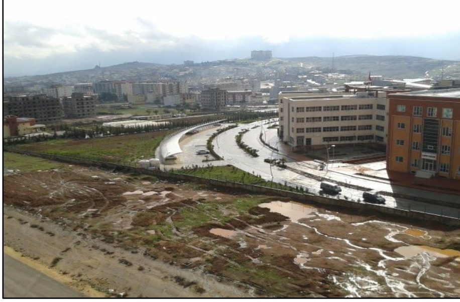
Foto 2: Şiddetli yağışlardan sonra alt yapının yetersiz olduğu Kilis Şehri çamur deryası haline gelmektedir.