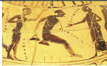
Şekil 10. Ağırlıklarla uzun atlama, sağda antrenör. Amphora üzerinde betimlenen atlayan atlet. İsa'dan önce 540.