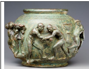
Şekil 1. Roma kabında, iki çıplak sporcu, müsabaka başlangıcında biri diğerine üstünlük sağlamaya çalışıyor.