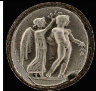
Şekil 11. Ödül töreni, İsa'dan önce IV. Yüzyıl