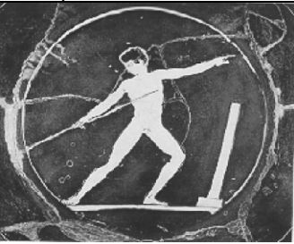
Şekil 9. Gymnasiumda cirit atma