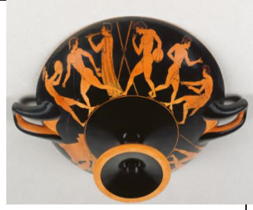
Şekil 5. Pentatlon yapan çıplak sporcuları gösteren içme bardağı.

3.5. Bazı figürlerin yorumlanması: Şekil 5'te bir flüt oyuncunun yanında (sporcuların hareketlerine yardımcı olmak için bir ritim veren) iki disk atıcısı ve bir sporcu (uzun atlayıcı). İki cirit oyuncu flüt çalmanın yanında duruyor. En sağda bir sporcu sert toprağı gevşetmek için bir topuzu kullanır. Toprak gevşek olduğunda uzun atlamacı kendini incitmeyecek, disk düştüğü yer kolay belli olacak ve cirit düzgün bir şekilde yere saplanacaktır. Şekil 6'ya göre eğer çıkıştan yanlış çıkanlar olursa kırbaçlandıkları veya yanlışlığı belirtmek için ip atma faaliyeti olduğu ileri sürülür. Kırbaçlama ve ip atma faaliyeti belki bu amaçlar için olabilir. Şekil 7'de avcılarının dövülmesi için sopa tutan yetkililer rakiplerin arasına serpiştirilmiş durumda. Soldan sağa: zırhlı yarışçı, uzun atlamacı ya da sprinter, disk atıcısı, flüt çalan biri, cirit atıcısı, güreşçiler ve pankreas yapan sporcular görülmektedir. Kaybeden veya yenilgiyi kabul eden bir sporcu teslim olduğu anlamında bir parmağını kaldırır. Şekil 8'de bir lahit kapağında sporcular hareket halinde gösterilir. Koşucular sağa doğru koşarlar, kolları sıra dışı bir sallanma hareketiyle uzanır. Bunu zırhlı bir yarışçı takip ediyor. Sol taraftaki bir sporcu ayakta izlerken görülürken diğeri zıplamak veya egzersiz yapmak için ağırlıkları tutarken, pentatlonun olayları için toprağı hazırlamaktadır.