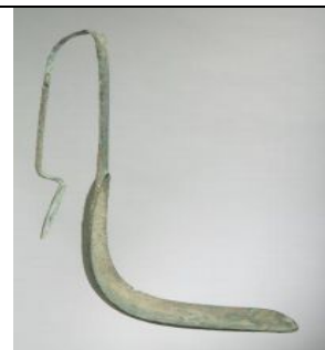
Şekil 3 9. M.Ö. 4. yüzyıla ait "strigil," http://www.harvardartmuseum.org/art/304007