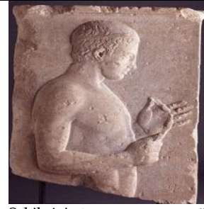
Şekil 4. Antrenman veya müsabaka sonrası "strigil" kullanarak kendini kum ve yağdan temizleyen sporcu tasvir eden mermer kabartma, M.Ö. 470-460