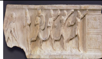
Şekil 8. Bir lahit kapağında sporcular