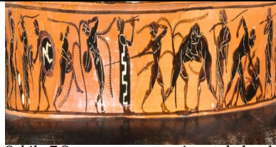
Şekil 7. Şarap veya su içme kabında sportif manzara