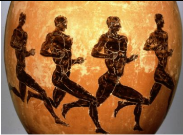
Şekil 6. Sprint koşucuları.

3.5. Bazı figürlerin yorumlanması: Şekil 5'te bir flüt oyuncunun yanında (sporcuların hareketlerine yardımcı olmak için bir ritim veren) iki disk atıcısı ve bir sporcu (uzun atlayıcı). İki cirit oyuncu flüt çalmanın yanında duruyor. En sağda bir sporcu sert toprağı gevşetmek için bir topuzu kullanır. Toprak gevşek olduğunda uzun atlamacı kendini incitmeyecek, disk düştüğü yer kolay belli olacak ve cirit düzgün bir şekilde yere saplanacaktır. Şekil 6'ya göre eğer çıkıştan yanlış çıkanlar olursa kırbaçlandıkları veya yanlışlığı belirtmek için ip atma faaliyeti olduğu ileri sürülür. Kırbaçlama ve ip atma faaliyeti belki bu amaçlar için olabilir. Şekil 7'de avcılarının dövülmesi için sopa tutan yetkililer rakiplerin arasına serpiştirilmiş durumda. Soldan sağa: zırhlı yarışçı, uzun atlamacı ya da sprinter, disk atıcısı, flüt çalan biri, cirit atıcısı, güreşçiler ve pankreas yapan sporcular görülmektedir. Kaybeden veya yenilgiyi kabul eden bir sporcu teslim olduğu anlamında bir parmağını kaldırır. Şekil 8'de bir lahit kapağında sporcular hareket halinde gösterilir. Koşucular sağa doğru koşarlar, kolları sıra dışı bir sallanma hareketiyle uzanır. Bunu zırhlı bir yarışçı takip ediyor. Sol taraftaki bir sporcu ayakta izlerken görülürken diğeri zıplamak veya egzersiz yapmak için ağırlıkları tutarken, pentatlonun olayları için toprağı hazırlamaktadır.