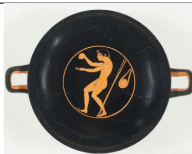
Şekil 2. Bir içki bardağın iç kısmında, bir sporcu egzersiz yapmaya veya yarışmaya hazırlanırken avucuna yağ döküyor.