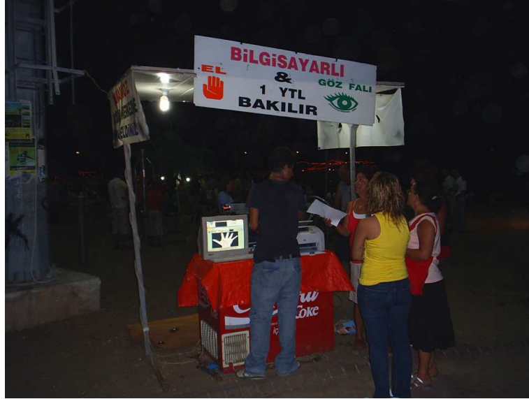
Teknoloji, "gelecek merakı"nın hizmetinde