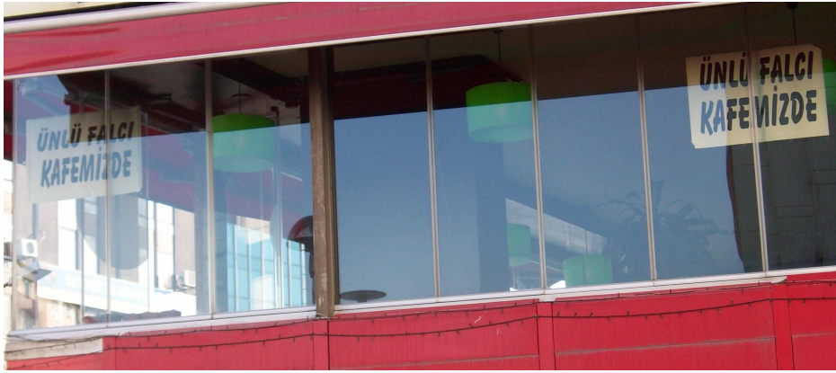
18.04.2009 tarihinde Ankara Kızılay'daki bir kafeden alınan görüntü.

Geleceği öğrenme isteği ve bu isteğin karşı konulamazlığını fark ederek bunu ticarî bir kazançta dönüştürmeyi arzu edenler, doksanlı yılların sonları ile iki binli yılların başlarında özellikle Ankara, İstanbul gibi büyük şehirlerde yasalara rağmen fal kafelerin 6 açılmasını sağlamış ve gördüğü rağbet nedeniyle de çok kısa bir zaman içerisinde bunların sayısında patlama yaptırmıştır. Camlarındaki ya da tabelalarındaki “ Kahve sizden, falınıza bakmak bizden. ”, “ Türk kahvesi + fal 5 milyon ”, “ Tarot falına bakılır. ”, “ Tarot 10 milyon ” “ Fala inanma, falsız kalma. ” gibi ibarelerle müşteri çekmeye çalışan ve çok kısa bir zaman zarfında hatırı sayılır bir sektör haline dönüşen bu tür yerlerde fal bakmak, yukarıda sözünü ettiğimiz kanun hükmü uyarınca 2005’in sonlarında yasaklanmıştır. Ancak bunların bir kısmı faaliyetlerine gerek kendi mekanlarında ve gerekse internet üzerinde yine devam etmektedir: