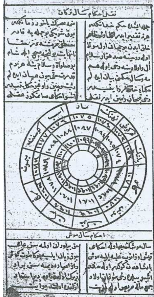
Rızayî'nin manzumesinin Süleymaniye Kütüphanesi Fatih Bölümü Nu: 3428'deki nüshasının ilk sayfası