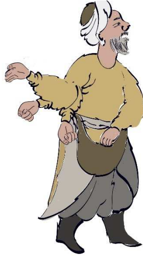
Şekil 3: Karakter Tasarımı (Animasyona Hazır)