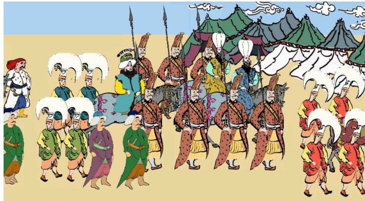
Şekil 7: Mekan, Karakterler ve Canlandırma Sahnesi