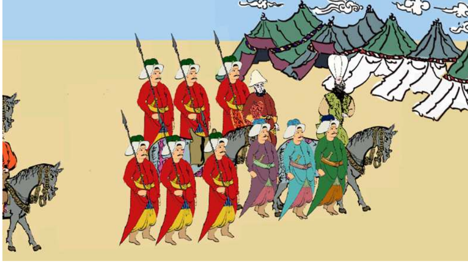
Şekil 6: Mekan, Karakterler ve Canlandırma Sahnesi

Şekillerde şenliğe katılan ve ayrı düzlemler halinde çizilen figürler yer almaktadır.