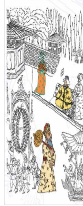
Şekil 5: Mekân Eskiz ve Tasarımı

Şekillerde şenliğe katılan ve ayrı düzlemler halinde çizilen figürler yer almaktadır.