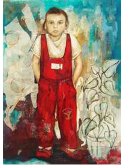
Görsel 13. Bahar, t.ü. karışık teknik, "Ben"

Arzu, aile geçmişine ilişkin edindiği bilgilerin onda uyandırdığı duyguları çalışmalarına aktarmaya çalışmıştır: Kendi öznel tarihimde hani bilmediğim çoğu şeyin ortaya çıkmasına neden oldu ...annem olsun babam olsun annemin mesleği olsun babamın mesleği ya da babaannemin kendi geçmişinden gelen şeyler hakkında çoğu şey kazanmış oldum bunu tasarım sürecine geçirip de tuval üzerine ya da bi yüzeye aktarmam da benim için çok ayrı bir deneyim oldu (G2. 16- 21st.).