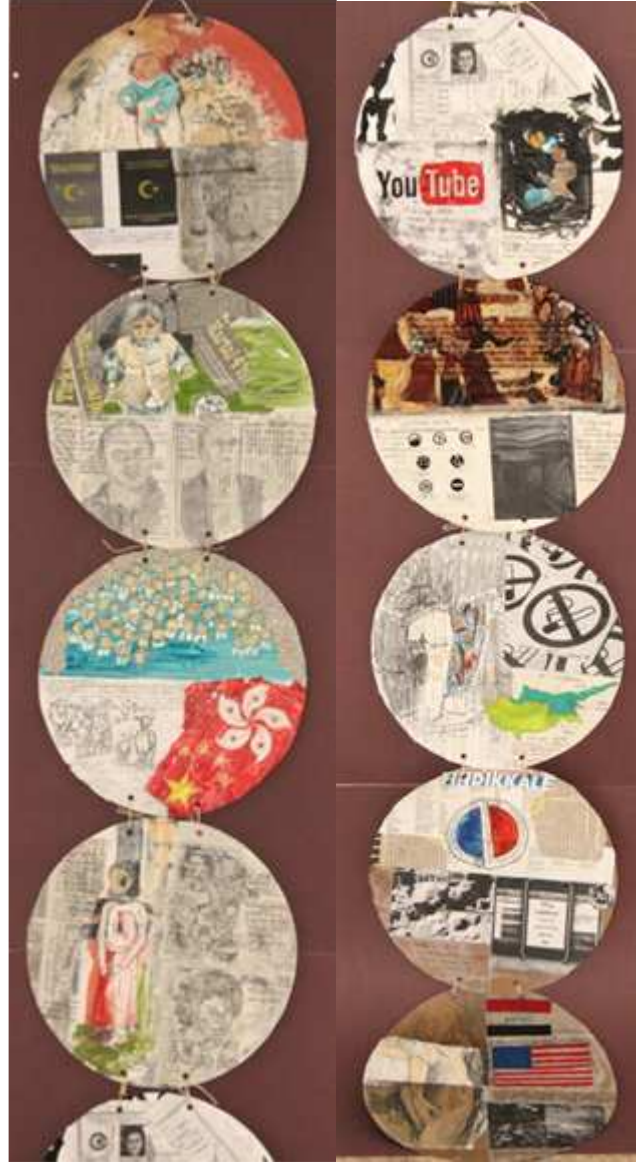
Görsel 8. Arzu, kağıt üzerine karışık teknik, öznel tarih şeridi

Öznel tarih şeridinde Süleyman Demirel'in portresinin yer almasına ilişkin anısını ise Arzu şu şekilde ifade etmektedir: Benim tam böyle hani tarih derslerine inkılap derslerine... tam olarak sözele yoğunlaştığım dönemlerde Süleyman Demirel o zaman cumhurbaşkanıydı bi de benim bi ödevim vardı işte Süleyman Demirel'e kadar olan cumhurbaşkanlarının isimlerini tek tek tek hoca istemişti bizden o zaman internet bi şey yok... anne ev hanımı çalışmıyor baba esnaf ne bilebilirler ben onlardan 9 tanesinden 4 tanesini ya da 5 tanesini bulabilmişim.... Süleyman Demirel'i orda[interneti kastediyor] gördüğümde ha bunu yapıcam... demiştim(G2.759- 779st.).