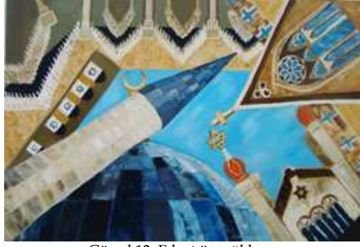
Görsel 12. Eda, t.ü. yağlıboya

“Mekânın sorgulanması”na ilişkin görüşler: Özellikle yerleştirme çalışmalarında mekân birebir sanatsal çalışmanın amacı olması nedeniyle, tuval üzerine yapılan resimlerde ise mekânların değişen anlamları temelinde çeşitli sorunlar, çözümler ve anlamlandırmalar ortaya çıkmıştır. Öğrenciler bu konularda aşağıdaki görüşleri bildirmişlerdir.