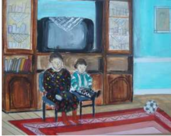
Görsel 3. Ayça, kağıt üzerine karışık teknik, “Zaman III”

Ayça ise görüşmede kendi geçmişi yanında tarihin çok uzun bir geçmişe sahip olduğunu ancak kendi tarihinin de önemli olduğunu ifade etmiş ve Frida örneğini vermiştir: Tarih dediğiniz aşlında çok geniş kapsamlı. Hani sonuçta milattan öncesi de vardır sonrası da vardır, günümüz tarihi de var. Ama benim açımdan bakacak olursak 20 yıllık bir tarihim var benim. Ama bu benim tarihim....Başkaları için bir şey ifade etmese de benim için ifade ediyor.... değerlendirecek olursam....herkes kendini yansıtmış mesela... Meksikalı bir tane kadın vardı... Frida mesela kendi geleneksel yapısını yansıtmış dünya tanımış... kendimizden yola çıkmak, bizden bir şeyler katmak (G4.296- 317st.).