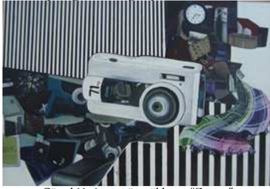
Görsel 11. Ayça, t.ü. yağlıboya, "Zaman"

"Zamanın sorgulanması"na ilişkin görüşler: Öznel tarih projesinde, öğrenciler zaman sorgulamasını, geçmiş ve şimdi, bireysel ve toplumsal çerçevede yapmışlardır. Bu durum görüşmelerde çocukluk kavramıyla, gelenek kavramıyla, gazete imgesiyle, anılarla ifade edilmeye çalışılmıştır.