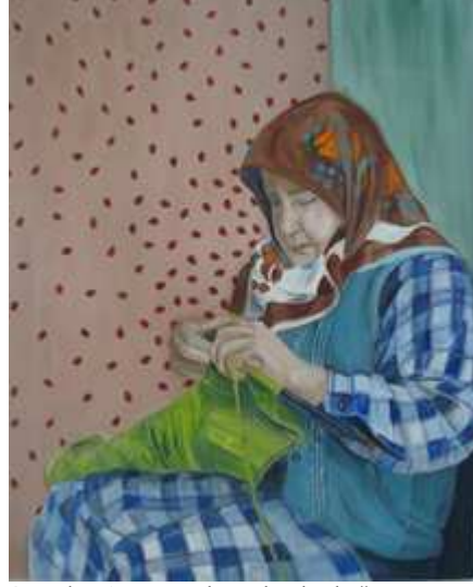
Görsel 9. Ayça, t.ü. karışık teknik, "Zaman IV"

Ayça resimlerinde geleneksel değerleri ele almasının nedenini lise öğretmenini örnek almak olarak açıklamıştır: Güzel sanatlar lisesinden geldim...resim hocam şey çalışıyordu böyle geleneksel aile yapısını. Ben aslında onu görerek biraz da eğildim bu konuya. Çünkü çok beğeniyordum onun çalışmalarını. İşte sergilerine gidiyordum. Sergi falan açıyordu çok hoşuma gidiyordu.... Aile yapısından da kaynaklanıyor aslında(G4. 94-99st.). Geleneksel değerler açısından ailesindeki bireylerin onun için önemini ise şu şekilde ifade etmektedir: Sevdiklerimi çalışıyorum genellikle... Dedem olsun işte babaannem olsun çünkü onlar benim için çok değerli, ailem benim için çok değerli onları kullanmayı seviyorum(G4. 202- 205st.).