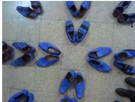
Görsel 1. Arzu, yerleştirme, “Kunduralar”