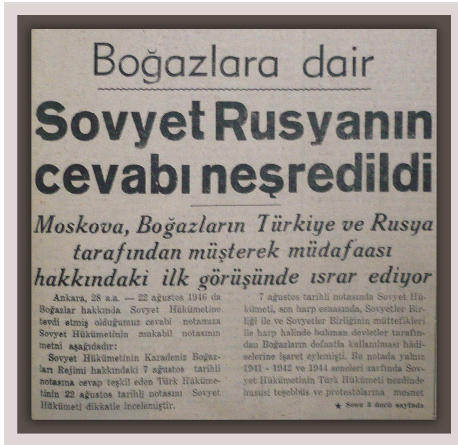
Ulus, 29 Eylül 1946