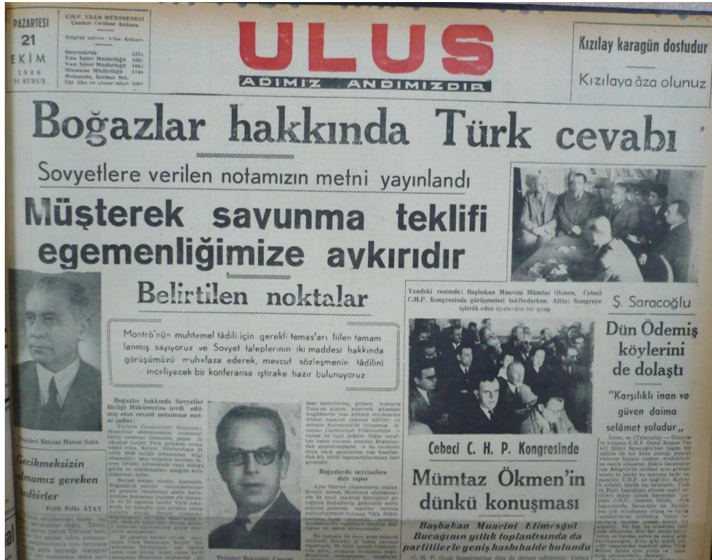
Ulus, 21 Ekim 1946