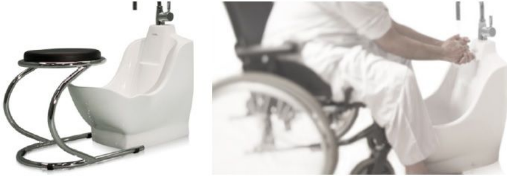
Şekil 1. Engelliler için kolaylık sunan abdest alma yeri (Nazem, 2016, 280)

İslam dini kolaylaştırma üzerine kurulduğu, çeşitli metinlerde görülmektedir Bu bağlamda dine hizmet eden mescitler ve camilerin de toplumun her kesimi için ulaşılması kolay olmalıdır. Yaşlıları merdivenler ile yormak, kadınların nerede saf tutacaklarını düşünmemek, engellileri camilerden soyutlamak ya da çocukları camilerden uzaklaştırmak İslam dininin gereği olamayacağı açıktır.