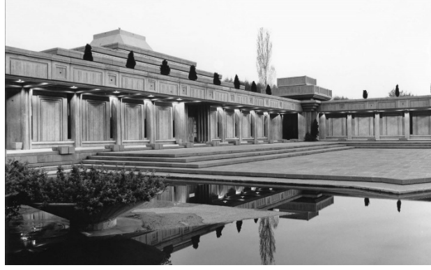
Şekil 7: TBMM Cami, Ankara (URL-6)