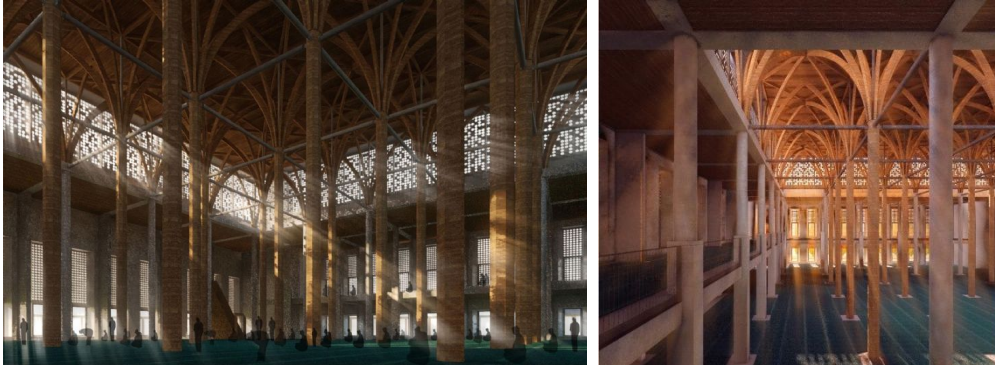
Şekil 6: Mehmet Kavuk Cami, Malatya (URL-5)

alının yere dokunduğu secde durumu ile normal huzur ve temaşa pozisyonu olan bir oturuş biçimi vardır. Caminin iç mekânı bu pozisyondan görülecek şekilde düzenlenir; yani caminin iç mekânı yer ile ilişkilidir” (Burckhardt, 2013, 49).