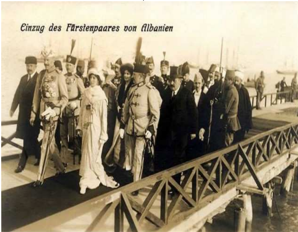
Prens Vid, Arnavutluk'ta

http://illyriapress.com/100-years-ago-great-powers-approved-king-albania [Erişim: 26.01.2016]