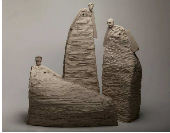
Fotoğraf 5: Gökçe Özer Eröz, "Aramızda Mükemmel Olmayan Var Mı?" Düzenleme, Stoneware

Yine aynı proje kapsamında gerçekleştirdiği "Aramızda Mükemmel Olmayan Var mı?" isimli seri çalışmalarında sanatçı, seramiğin en temel tekniklerinden olan sucuk tekniğini kullanmıştır. Bilinçli olarak bırakılan parmak izleri ve deformasyonlar çalışmaların kavramsal anlamıyla da bütünlük sağlamıştır. Sanatçı bu çalışmaları hakkındaki yaratım süreci için şu dizeleri kaleme almıştır;