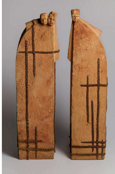
Fotoğraf 4: Gökçe Özer Eröz, “Başlarla Baş Edemiyorum XII”, 2012,48.00x33.00x10.00 cm, Stoneware

2013 yılında lisansüstü tez projesi kapsamında gerçekleştirdiği seri çalışmaları “Başlarla Baş Edemiyorum” ve “Aramızda Mükemmel Olmayan Var mı?” yalın formları ve sırsız yüzeyleri ile sade bir estetiğe sahiptirler. Özellikle Başlarla Baş Edemiyorum isimli seramik heykel serisi figüratif formlara sahip olmalarının yanında düz ve gösterişten uzak görüntüleri ile dikkat çekicilerdir.