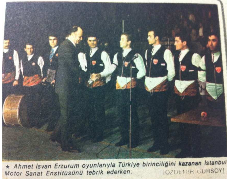
Şekil 5: 1974 yılı yarışma birincisi Şişli Motor Sanat Enstitüsü Erzurum Ekibi (25 Nisan 1974 tarihli Milliyet Gazetesi'nden)