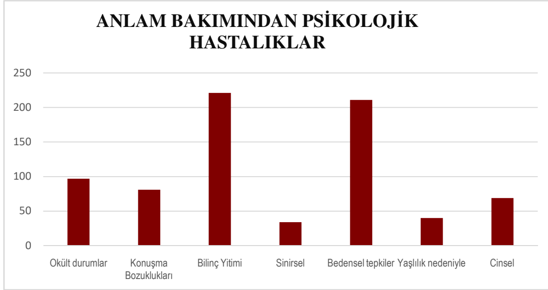
Grafik 2: Anlam Bakımından Psikolojik Hastalıklar

3. Bu hastalıklardan bilinç yitimi şeklindeki hastalıklar, akıl hastalıkları, sinirsel psikolojik hastalıklar ve yaşlılığın beraberinde getirdiği hastalıklar uzun süreli örtmece hastalıklar grubundadır. Konuşma bozuklukları, tedavisi mümkün olan örtmece hastalıklara, okült durumlar korku, hurafe ve inançlara dayalı örtmece hastalıklara, son olarak cinsel hastalıklar ise ayıp, kaba ve müstehcen kabul edilen örtmece hastalıklara örnektir.