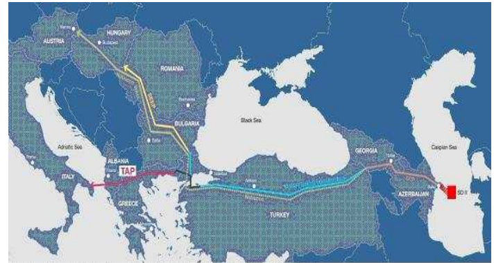
Şekil 1: Güney Gaz Koridoru: TANAP - TAP & NABUCCO ve SEEP Boru Hatları

Doğu Akdeniz'den Türkiye'ye aktarılması muhtemel bu kaynakların hangi boru hattına bağlanacağı ise meselenin ikinci boyutunu oluşturacaktır. Bu noktada ön plana çıkan boru hattı; Azerbaycan-Gürcistan-Türkiye rotasıyla Yunanistan ve İtalya üzerinden devam eden Trans Anadolu Projesi yani TANAP'tır.