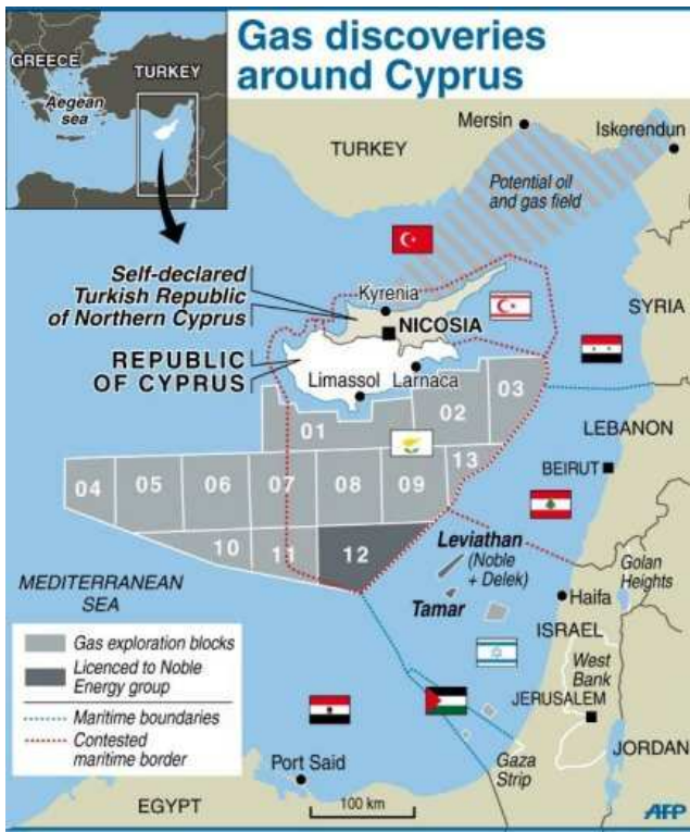
Kıbrıs çevresindeki gaz keşifleri 16

2011 yılı ortalarından itibaren Doğu Akdeniz’de Kıbrıs sorunu ve hatta dünya politikaları ile genel olarak enerji piyasasını etkileyecek önemli bir gelişme yaşanmıştır. Ağustos 2011’de Kıbrıs’ın güneyinde bulunan doğalgaz rezervleri konusunda kapsamlı araştırmalara başlayan Güney Kıbrıs Rum Yönetimi, 15 Eylül’de ABD’li Noble ve İsraili Delek firması tarafından doğalgaz aramaları için kullanılacak olan “Afrodit” olarak isimlendirilen platform 12. parselde bulunmuş ve 18 Eylül’de sondaj işlemine başlamıştır. 17 Bu gelişmeler üzerine Kısacık’ın ifadesiyle; “Rum tarafının sondaja başlamasından dolayı BM 66. Genel Kurulu çerçevesinde görüşmelerde bulunmak ve temaslar gerçekleştirmek üzere New York’ta bulunan KKTC Cumhurbaşkanı Derviş Eroğlu ile Başbakan Recep Tayyip Erdoğan arasında 21 Eylül 2011’de KKTC ile Türkiye arasında Kıta Sahaneliğini Sınırlandırma Anlaşması’na imza konulmuştur.” 18 Cumhurbaşkanı Eroğlu, imza konulan