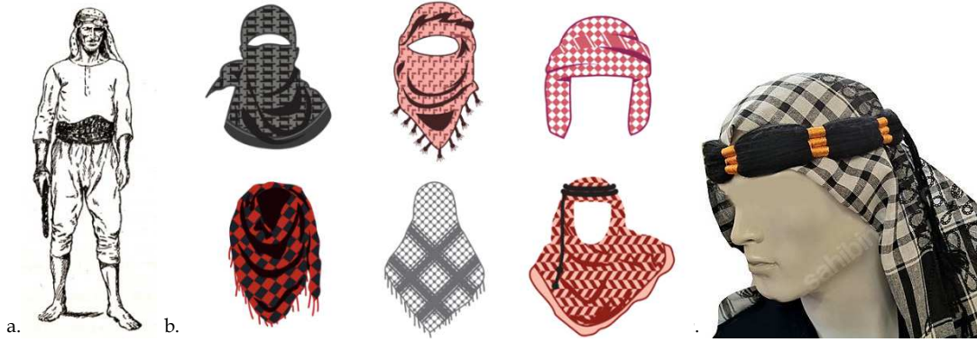
Fotoğraf 1. a.Başında kefiye ile tulumbacı reisi (Koçu, 2015:161), b. Kefiye 'nin bağlanma şekilleri (URL 1), c. Kefiye üzerine agel kullanımı (URL 2).

Yazılı kaynaklardan kefiyenin genellikle giysi amaçlı üretildiği görülmektedir. Özellikle erkeklerde sarık amacıyla, kadınlarda ise kimi zaman örtme kimi zamanda bele bağlanarak kullanıldığı anlaşılmaktadır.