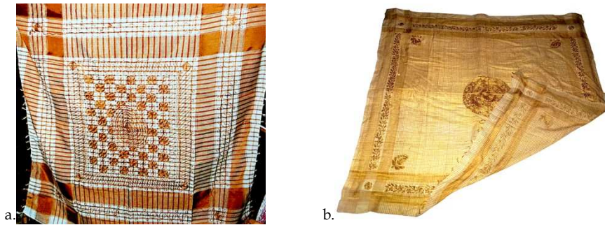
Fotoğraf 2. a. Cülha dokuması (Akpınarlı, 1996:68) b. Abani kumaş (Tezcan, 2017:269)

Denizli ilinin Buldan ilçesinde dokunduktan sonra kasnağa gerilen kumaşın üzerine yapılan bu işlemeye "kaplama" (Atalayer, 1991,69-70) denildiği de bilinmektedir. Yazılı kaynaklardan kefiye bezinin kumaş kimlikleri hakkında fazla bir bilgiye ulaşılamamaktadır. Sadece hammaddesinin ipek olduğu anlaşılmaktadır. Bu bağlamda envanter kayıtlarında kefiye olarak isimlendirilmiş 2 örneğin (Fotoğraf 3.a. ve b.) teknik analizleri yapılarak dökümleri Tablo 2'de sunulmuştur.