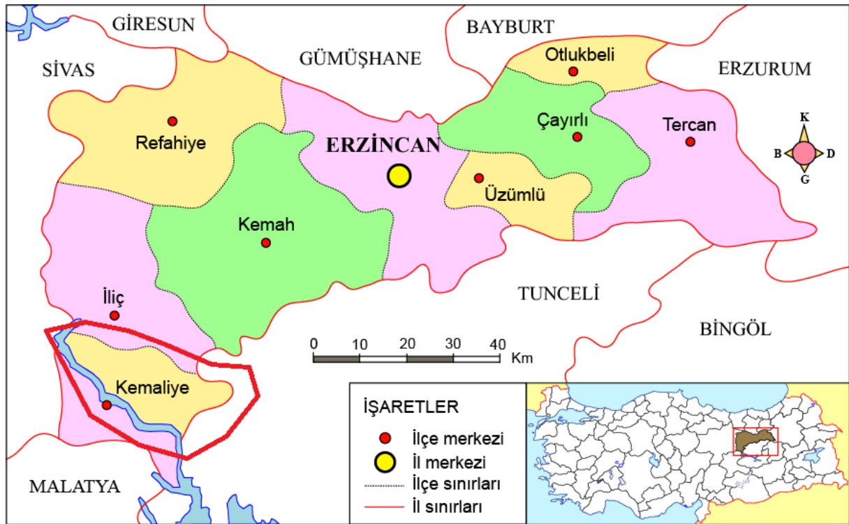
ERZİNCAN İLİ HARİTASI

Erzincan şehri tarihin erken dönemlerinden beri çok sayıda deprem yaşamış, bu depremler geçmişe ait birçok mimari eserin yıkılmasına sebep olmuştur. Diğer mimari eserler gibi mektep binaları da bunlardan etkilenmiş, bu nedenle günümüze neredeyse gelebilen bir mektep binası bulunmamaktadır. Kemaliye, il merkezine uzak bir konumda bulunduğu için merkez depremlerinden çok fazla etkilenmemiş, bu durum ilçenin özgün mimari dokusunu korumasını sağlamıştır.