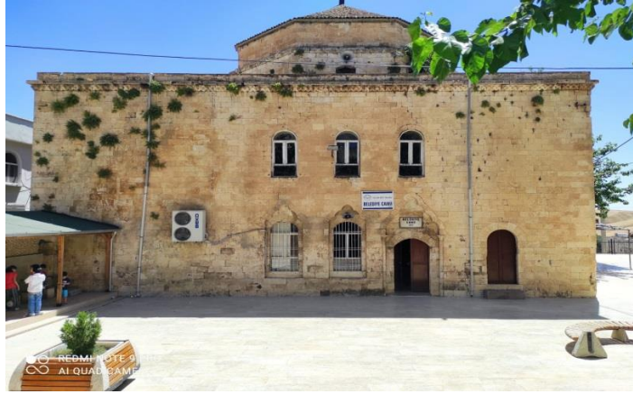
Keldâni Kilisesinden dönüştüğüne inanılan Silvan Belediye Camisi