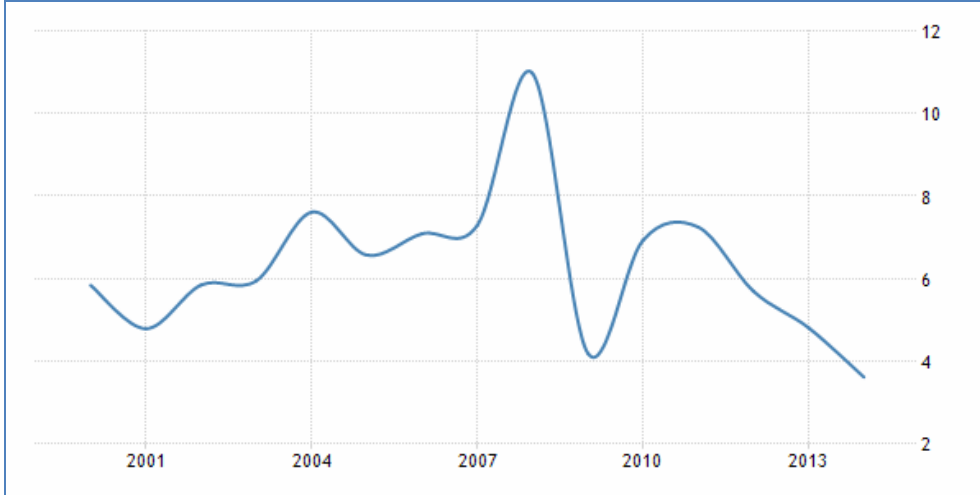
Grafik 1 : Sahra Altı Afrika'da Yıllara Göre Enflasyon (%)