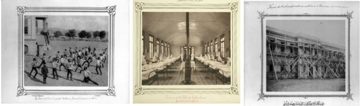
Şekil 7: Abdullah Biraderler, "Harbiye Öğrencileri Kılıç Taliminde", 1880-1893, Albüm no.49.

Bu görselden hareketle çözümlene yapacak olursak sosyolojik bir yorum yapma imkanımız bulunmaktadır. Kadınların başlarının örtülü olması ve arkadaki erkeklerin sarıklı ve fesli oluşları, çocukların ve diğer öğelerin biçimsel duruşları bizlere toplumun içinde bulunduğu gerçekliği yansıtmaktadır. Fotoğrafta fesin gençlerde sarıgın ise yaşlılarda tercih edildiği izlenimi vermektedir. Bu tercihlerde de görüldüğü üzere batılı değerleri yakından takip eden Osmanlı toplumunda halk içerisinde kültürel öğeler ile modern öğelerin bir arada kullanıldığı gerçekliği görülmektedir. Batı kamuoyuna mesaj niteliği taşıyan bu fotoğraflar Osmanlı devletinin yenilikleri yakından takip ettiği izlenimini de vermektedir.