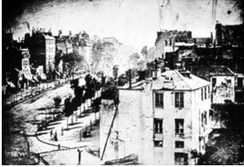
Şekil 3: Louis Daguerre, "Boulevard du Temple/Temple Bulvarı", 1838 ( https://tr.wikipedia.org/wiki/Louis_Daguerre , Erişim Tarihi: 15.11.2015)