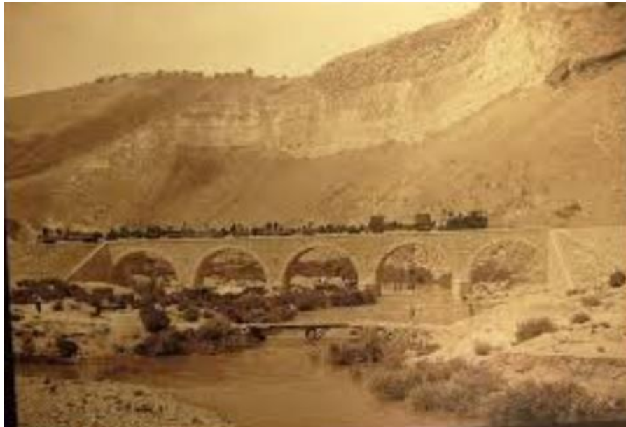
Şekil 5: Abdullah Biraderler "Hicaz Demiryolu Hattına dair fotoğraf", Köprü (1903) ( https://www.google.com.tr/search?q=Abdullah+Biraderler+%E2%80%9C Hicaz+Demiryolu+Hatt%C4%B1n%C4%B1n,+Amman+-+Maan+Hatt/ , (05.09.2018) )

Yukarıda ki fotoğrafta da görüldüğü üzere Hicaz Demiryolu inşasının her on beş-yirmi kilometresi bir kare fotoğraf olarak belgelenmiştir. Aslında bu yolla dönemin sultanı II. Abdülhamid Han bu yerlerin kayıtlara geçirmesini sağlamakla birden fazla amaç gütmüştür. Devletin içerisinde meydana gelen çalışmaların olumlu, kontrollü ve dönemin ruhuna uygun olduğu mesajını vermekte ve ima etmektedir. Diğer bir deyişle batılılaşma gelişmelerinin uygulandığını ve Osmanlı devletinin batılılaşma yönünde ve dönemin ruhuna uygun hareket ettiğini batı kamuoyuna işaret etmektedir.