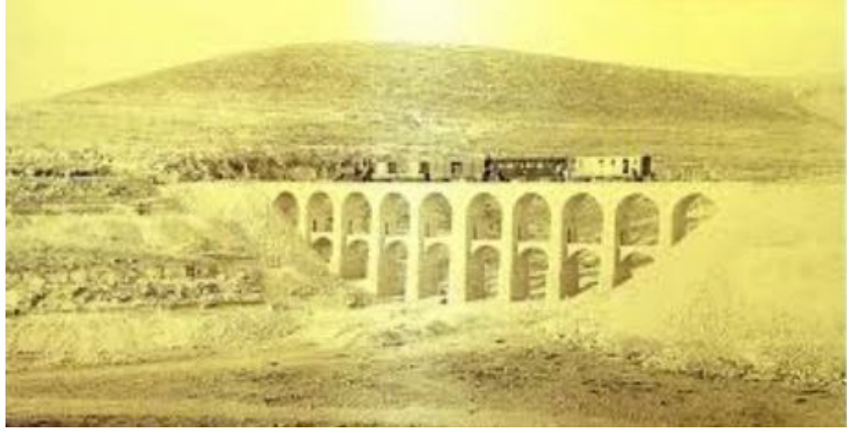
Şekil 4: Abdullah Biraderler "Hicaz Demiryolu Hattının, Amman - Maan Hattındaki Büyük Köprü" (1903) ( https://www.google.com.tr/search?q=Abdullah+Biraderler+%E2%80%9C Hicaz+Demiryolu+Hatt%C4%B1n%C4%B1n,+Amman+-+Maan+Hatt/ , (05.09.2018) )

başlıca atlar olmak üzere çiftlik ve haralardaki hayvan resimleri, silâh katalogları, gemi fotoğrafları vb. gibi yerler kayıt altına almıştır. Bu albümlerin coğrafi dağılım ise, büyük kısmı İstanbul ve Osmanlı toprakları olmakla birlikte hemen hemen bütün dünya olmuştur diyebiliriz. Bu gerçeklerden hareketle Osmanlı gözüyle İmparatorluğun genel görünümü ve yenileşme hareketleri ile ilgili fikir vererek yabancı toplumların ilgisini çekmek ve Osmanlı hakkındaki olumsuz fikirleri yok etmek amacıyla oluşturulmuş olan Yıldız Albümleri Osmanlının kötüye giden imajının düzeltilmesi ya da batılılaşma lehine olumlu katkı sağlamıştır. Bununla birlikte Osmanlı Devleti içerisinde yer alan albümler ise, II. Abdülhamid'in bilgilenmesine yönelik olarak düzenlenmiş ve muhafaza edilmiştir.