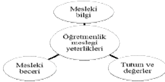
Şekil 1 Öğretmenlik mesleği genel yeterlikleri

Öğretmenlik mesleği yeterlilikleri, her öğretmenlik alanı için ayrı ayrı belirlenmek yerine genel yeterliklere ilave olarak “alan bilgisi ve alan eğitimi bilgisi” eklenmiş, böylece her alanın yeterliklerini kapsayacak şekilde bütünlük oluşturulmuştur (MEB, 2017). Genel yeterliklerle tutarlı ve ilişkili olan 11 alt kategorideki yeterlilikler aşağıdaki tabloda yer almaktadır.