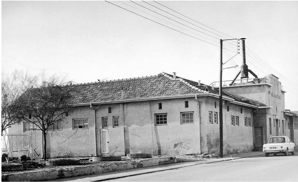
Limassol Karantina Binası