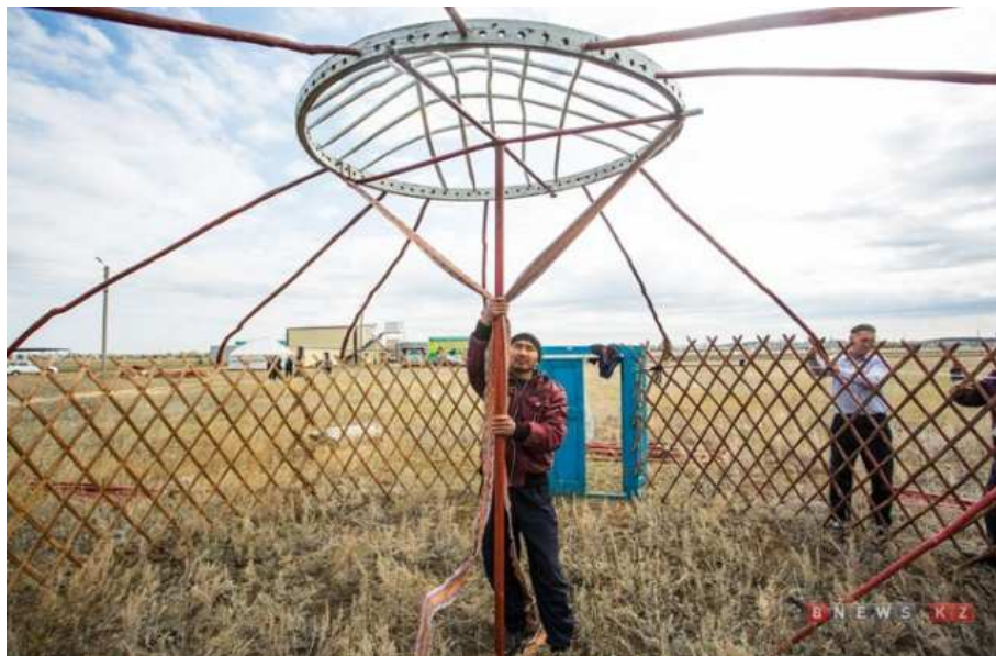
(Bakan ile şańırağın yükseltilmesi)

Kiyiz üyler genellikle ekim ayı içerisinde toplanır ve ardından Kökşetav'da yaşayan Kazak Türklerinin bir kısmı "tam" adı verilen, ağaç veya kerpiçten yapılan evlerinde kış mevsimini geçirmeye koyulur. Kiyiz üyün toplanmasına "cıgu" denilmektedir.