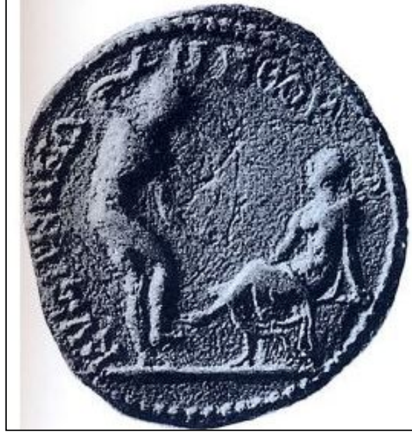
Resim:9. Dansa Davet. Kyzikos Sikkesi. MS 2. yüzyıl (Tisserent ve Siebert, 1986 Resim 39).