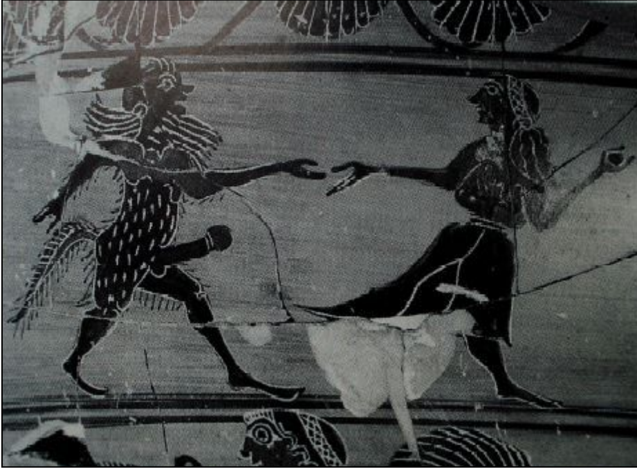
Resim:12. MÖ 580 yılına tarihlenen dinos üzerinde Satyr ve Nymphe dans etmektedir. (Dağlı, 2011 Levha 1.1).