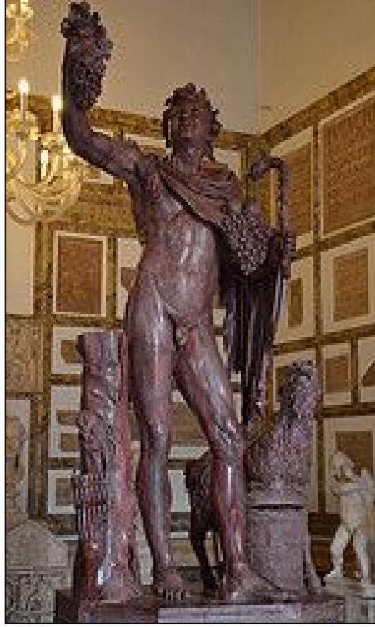
Resim:5. Fauno Rosso. Hadrian Villası'ndan. MÖ 3. veya 2. yüzyıla ait orijinal bir eserin, Roma İmparatorluk dönemi kopyası (Smith, 2013, 147 Resim 152).