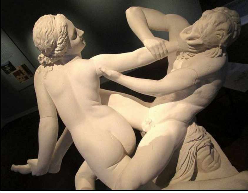
Resim:11. Satyr ve Nymphe/Hermaphroditos Grubu. MÖ 3. veya 2. yüzyıla ait bir orijinal eserin, Roma İmparatorluk dönemi kopyası (Pollitt, 1999: 132 Resim 140; Boardmann, 2005, 231 Resim 229).