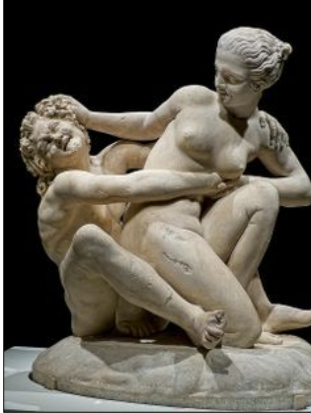
Resim:10. Satyr ve Nymphe Grubu. MÖ 3. veya 2. yüzyıla ait orijinal bir eserin, Roma İmparatorluk dönemi kopyası (Pollitt, 1987, 133 Resim 141).