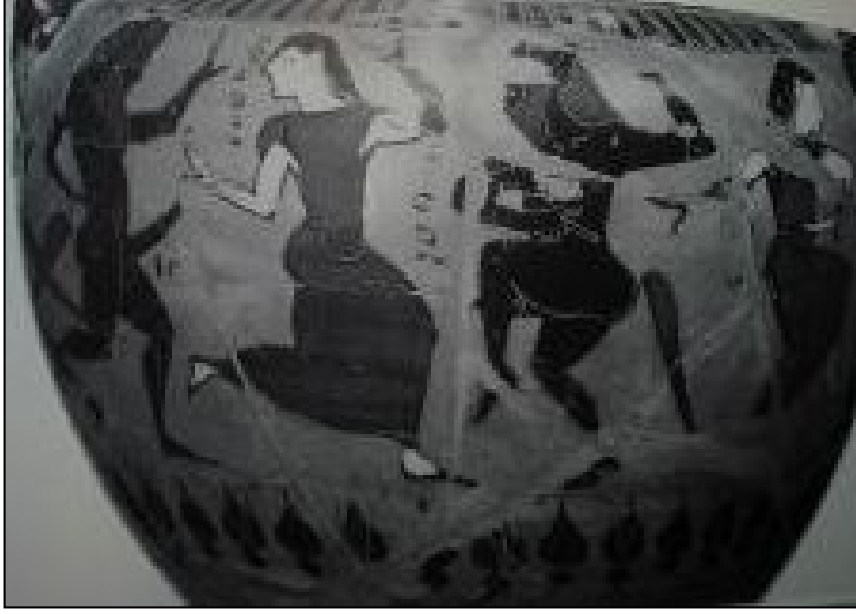
Resim:14-15. Siyah figürlü bir krater/amphora üzerinde birbirleriyle dans eden Satyrler ile birlikte Nympheler yer almaktadır. Her iki tasvirdeki ortak özellik Nymphelerin dans ederken krotala çalmaları ve bir kollarını yukarıya doğru kaldırmalarıdır (Dierichs, 1997, 28 Resim 27; Dağlı, 2011 Levha 2.3,4).