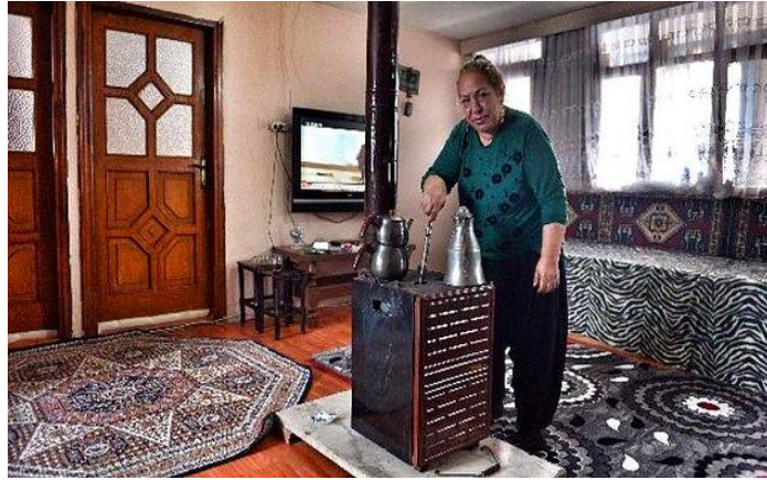
Şekil 7: Dilber Ay ve Evi

Dilber Ay yalnızca müziğiyle değil, aynı zamanda sinema filmlerindeki oyunculuğuyla da öne çıkan bir isimdir. Öyle ki, Sırrı Süreyya Önder’in yazıp yönettiği 2007’de gösterilen “Beynelmielel” filmindeki rolüyle en iyi yardımcı kadın oyuncu “Altın Koza” ödülünü alır. Aynı filmde “Akşama Geleceğim” veya daha yaygın olarak bilinen “Tavukları Pişirmişem” adlı türküyü seslendirmesiyle ününe ün katar. Birçok eğlence ve kutlamalarda Dilber Ay’ın seslendirdiği bu türküyü özel bir yer verirler. Örneğin, 2014 yılında Fenerbahçe Spor Kulübü’nün şampiyonluk kutlamasında stadı dolduran taraftarın önünde futbolcuların sahada “Tavukları Pişirmişem”e oyun ve alkışlarla eşlik etmeleri, türkünün ne kadar popüler olduğunu, kitleler üzerine nasıl nüfuz ettiğini gösterir.