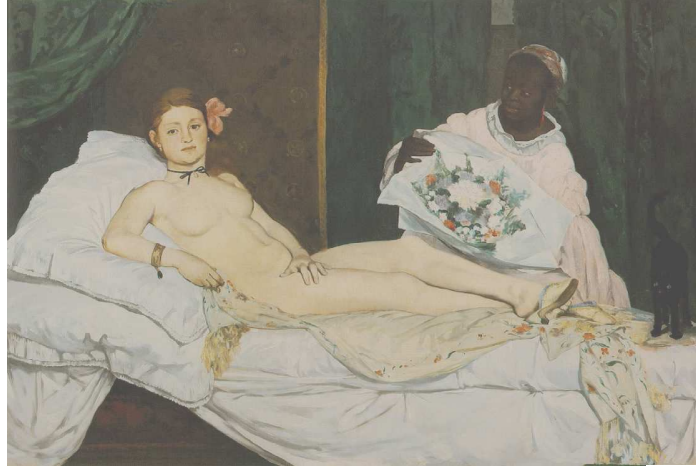
Resim 2. Manet, Eduoard, "Olympia", 1863, Tuval üzerine yağlıboya, 130.5 x 190 cm, Musee d'Orsay, Paris.

ise kedi, siyah olmaması koşulu ile uğurlu ve kutsal bir hayvan olarak kabul edilmiştir. Hz. Muhammed'i yılanlardan koruyan hayvan olarak betimlenmiştir.