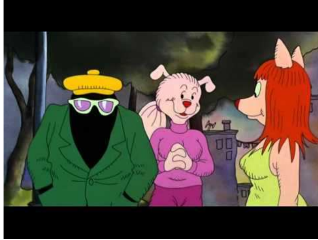
Resim 4. Fritz The Cat (1972) animasyon filminden bir sahne örneği. ("Fritz The Cat, 1972". 15.05.2015)

Kargalar ise 1960'lar Amerika Birleşik Devletleri'nde, Amerika Birleşik Devletleri'nin çok kültürlü ve uluslu yapısı içerisinde ayrımcılığa uğrayan Afro-Amerikalıları betimlemektedir. Afro-Amerikalılar, çizgi romanın pek çok sahnesinde Hippi Hareketi mensuplarına uyuşturucu satmaktadır ve bütün bir öyküde hikâye akışını belirleyici roller almamakta fakat ara karelerde sıklıkla belirmektedirler (Bkz. Res.4).