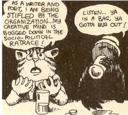
Resim 5. Kedi Fritz çizgi romanından bir görsel (Crumb, 2014)

Kargalar ise 1960'lar Amerika Birleşik Devletleri'nde, Amerika Birleşik Devletleri'nin çok kültürlü ve uluslu yapısı içerisinde ayrımcılığa uğrayan Afro-Amerikalıları betimlemektedir. Afro-Amerikalılar, çizgi romanın pek çok sahnesinde Hippi Hareketi mensuplarına uyuşturucu satmaktadır ve bütün bir öyküde hikâye akışını belirleyici roller almamakta fakat ara karelerde sıklıkla belirmektedirler (Bkz. Res.4).