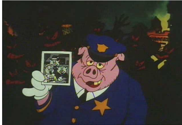
Resim 3. Fritz The Cat (1972) animasyon filminden bir sahne örneği. ("Fritz The Cat, 1972". 15.05.2015)

Kedinin genel anlamda cinselliği betimlemesi, köpek ya da başka hayvanlar gibi gerçek manada evcilleştirilememiş oluşu, ondaki özgürlükçü tavır, Crumb tarafından Hippi Hareketinin ruhu ile eşleştirilmiş olabileceği ihtimalini doğurmaktadır.