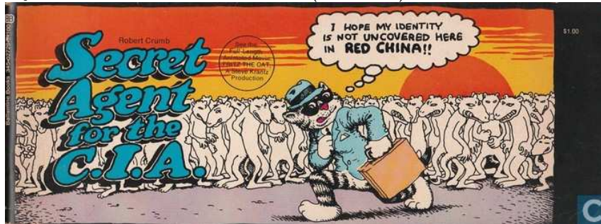
Resim 6. Kedi Fritz'in CIA ajanı olarak görev yaptığı sahneler ( http://comixjoint.com/fritzthecat3books.html , 15.05.2015)

Ara karelerde betimlenen kargalar üzerinden ABD'deki ayrımcılık, ırkçılık meselesi Crumb'ın değindiği meselelerden biri olmaktadır. Örneğin Kedi Fritz, bir sahnede barda rastladığı karga ile kargaların maruz bırakıldığı ırkçı yaklaşımlar hakkında sohbet etmektedir (Bkz. Res.5).