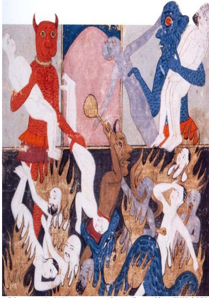
Resim 1: Cehennem, Ahval-i Kiyamet , 16. yüzyıl sonu 17. yüzyıl başı, SK Hafid Efendi 139.