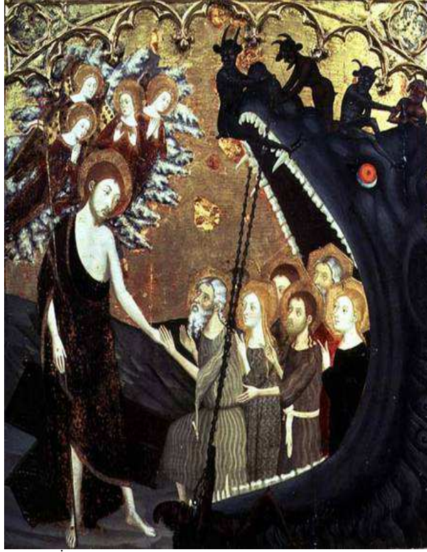
Resim 3: İsa’nın Araf’a İnişi, panel resmi, 13. yüzyıl, Jeume Serra (?-1389), Zaragoza, İspanya.

inançlarla birlikte kızıl bir ejderha olarak kabul görmüş ve şeytanla ilişkilendirilmiştir (Turner, 2004: 77-85). Bu durum bile hem İslam hem de Hıristiyan inancında ve dolayısı ile dini konulu resimlerde ejderhaya hemen hemen aynı anlamların yüklendiğini, ancak farklı resim anlayışlarından dolayı değişik ejderha biçimlerinde yapıldıkları göstermesi bakımından ilginçtir (Resim 3). Yine söz konusu tasvirin ve Hıristiyan ikonografisindeki “İsa’nın Cehennemi Ziyareti” veya “İsa’nın Araf’a İnişi” konularının benzerliği de başka bir dikkat çekici noktadır.