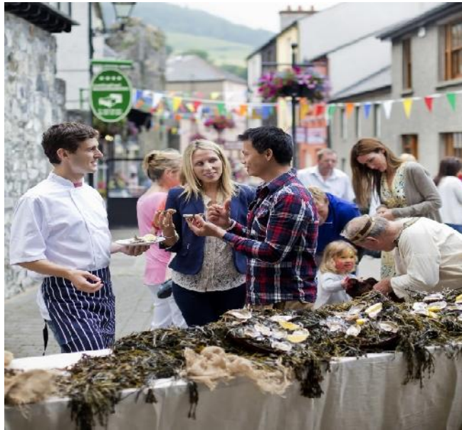
Fotoğraf 2. International Oyster & Seafood Festivali (verve.ie, 2017)

Paris Notre-Dame Katedrali'nin önünde Mayıs ayında 'Ekmek festivali' yapılmaktadır. Fransızların ünlü baget ekmeği yapılarak yarışmalar da düzenlenmektedir. Festival boyunca günde 3000 üzerinde ekmek üretilmektedir ( https://www.sortiraparis.com/hotels-and-restaurants/fooding/articles/40952-2017-bread-festival-in-paris/lang/en ).