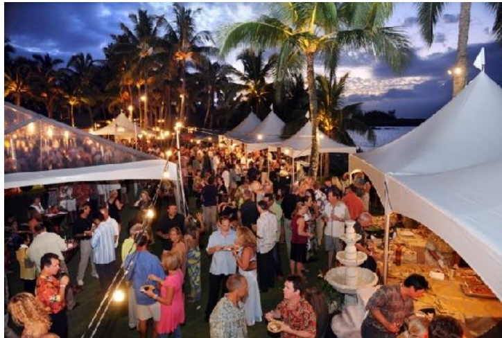
Fotoğraf 1. Hawaii Food and Wine Festival

“International Pinot Noir Celebration” ilk kez 1987’de Oregon ABD’de de gerçekleştirilmiştir. Dünyanın en nitelikli Pinot Noir üzümlerinden elde edilen birinci sınıf şarapları tadabilmek için dünyanın dört bir yanından Pinot Noir severler, Oregon’da buluşmaktadır. Şarabın ön planda olduğu festivale ABD’nin önde gelen şefleri de katılmaktadır. (ipnc.org).