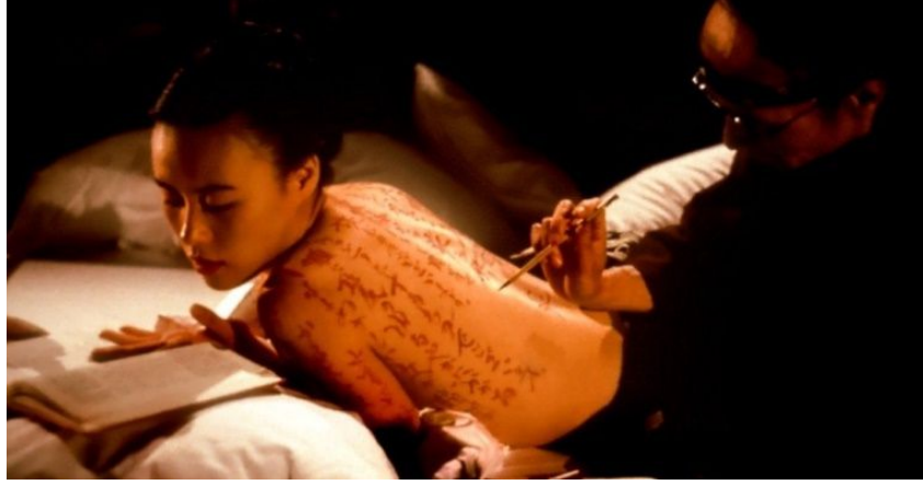
Resim 6: 'The Pillow Book'

Çağdaş sanatın en güçlü kadın sanatçılarından biri olan İran asıllı Shirin Neshat (1957-) 'ın Allah'ın Kadınları' serisinde siyah beyaz fotoğraflarda çarşafly kadınlar yer almaktadır. Ortadoğu, özellikle İranlı kadınların içinde bulunduğu açmazlara değinen Neshat, İslami iktidarın kadın bedeni üzerindeki kimlik oluşumuna dikkat çekmektedir.