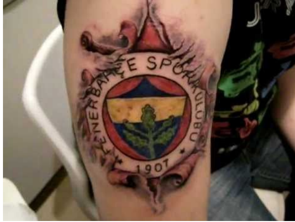
Resim 3: Aidiyeti temsil eden dövme

dönüştürmektedir. Kendini ifade etmenin dışında estetik kaygılarla yapılan dövme ile kişi kendini süslemek, bezemek, güzel olmak için de dövme yaptırmaktadır (Ertan, 2017, 199).