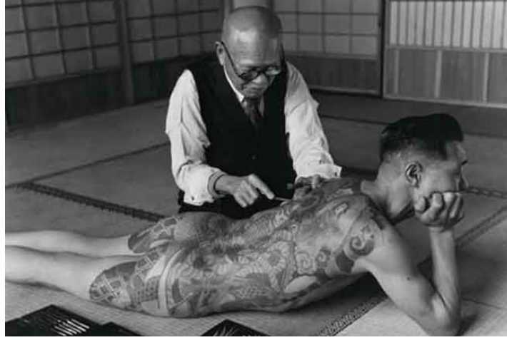
Resim 1: Geleneksel Japon Dövmesi

Amerikan yerli halkı arasında yaygın olarak kullanılan dövmeler üzerine yapılan araştırmada, Dövme yapılma amacının hayatın geçişini ya da bir bireyin yaşamındaki aşamalardan birinden diğerine geçişinin toplum tarafından tanınması (ilk av, savaşçı olma, evlenme) olduğunu gösteren bir delil olarak kişisel ayin görevi taşımaktadır (Schwarz, 2006, 226).