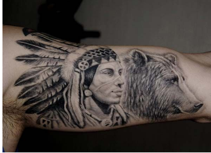
Resim 2: Kızılderili Dövmesi

Amerikan yerli halkı arasında yaygın olarak kullanılan dövmeler üzerine yapılan araştırmada, Dövme yapılma amacının hayatın geçişini ya da bir bireyin yaşamındaki aşamalardan birinden diğerine geçişinin toplum tarafından tanınması (ilk av, savaşçı olma, evlenme) olduğunu gösteren bir delil olarak kişisel ayin görevi taşımaktadır (Schwarz, 2006, 226).