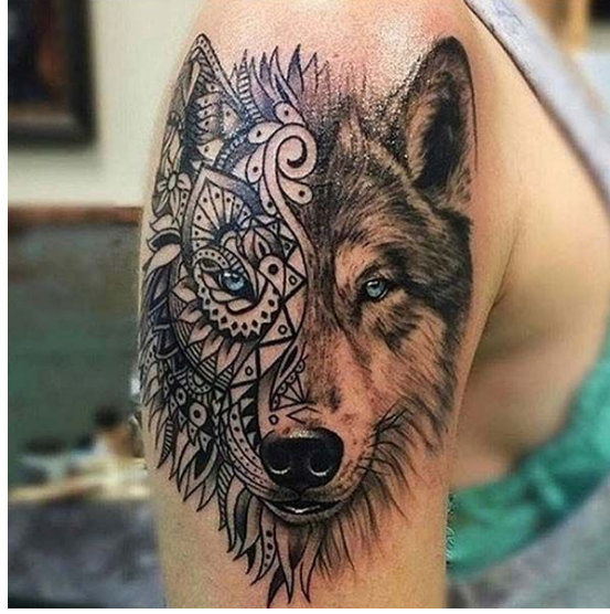
Resim 4: Gücü sembolize eden dövme

Dövmenin motifi, büyüklüğü ve taşıdığı anlamın cinsiyete göre değiştiği görülmektedir. Erkek dövmelelerinde sert, güçlü ve vahşi mesajlar yer alırken kadın dövmelelerinde estetik ve kibar motifler dikkat çekmektedir. Bu açıdan bakıldığında toplumsal cinsiyetin inşasında kadınlık ve erkeklik rollerinin ve görünümünün dağılımında dövme önemli bir göstergedir.