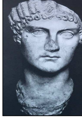
Resim:1. Caligula'nın kız kardeşi Iulia Drusilla. (Özgan, 2013: 104.)

Hanedanlığı döneminde ise alın üzerindeki saç tellerinin biraz daha abartılarak işlendiği bu saç modası; heykeltıraşlık eserlerinde ise matkap yardımıyla kör noktalar ya da yüzük şeklindeki halkalar biçiminde işlenmekteydi. Günümüz araştırmacıları tarafından da saçtaki bal peteği olarak yorumlanan bu kuaförlük modası (Resim:2,3.) aynı zamanda süngerimsi bir saç kütesi görünümündedir (Özgan, 2013, 43).