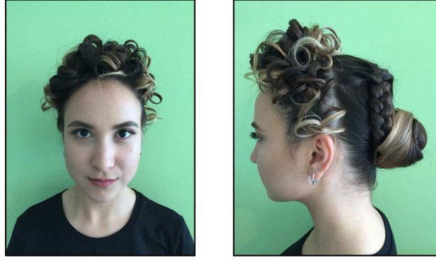
Resim:4,5. Flaviuslar Hanedanlığı kadın kuaförlük modasının günümüz uyarlaması. (N. Y. Zehir).