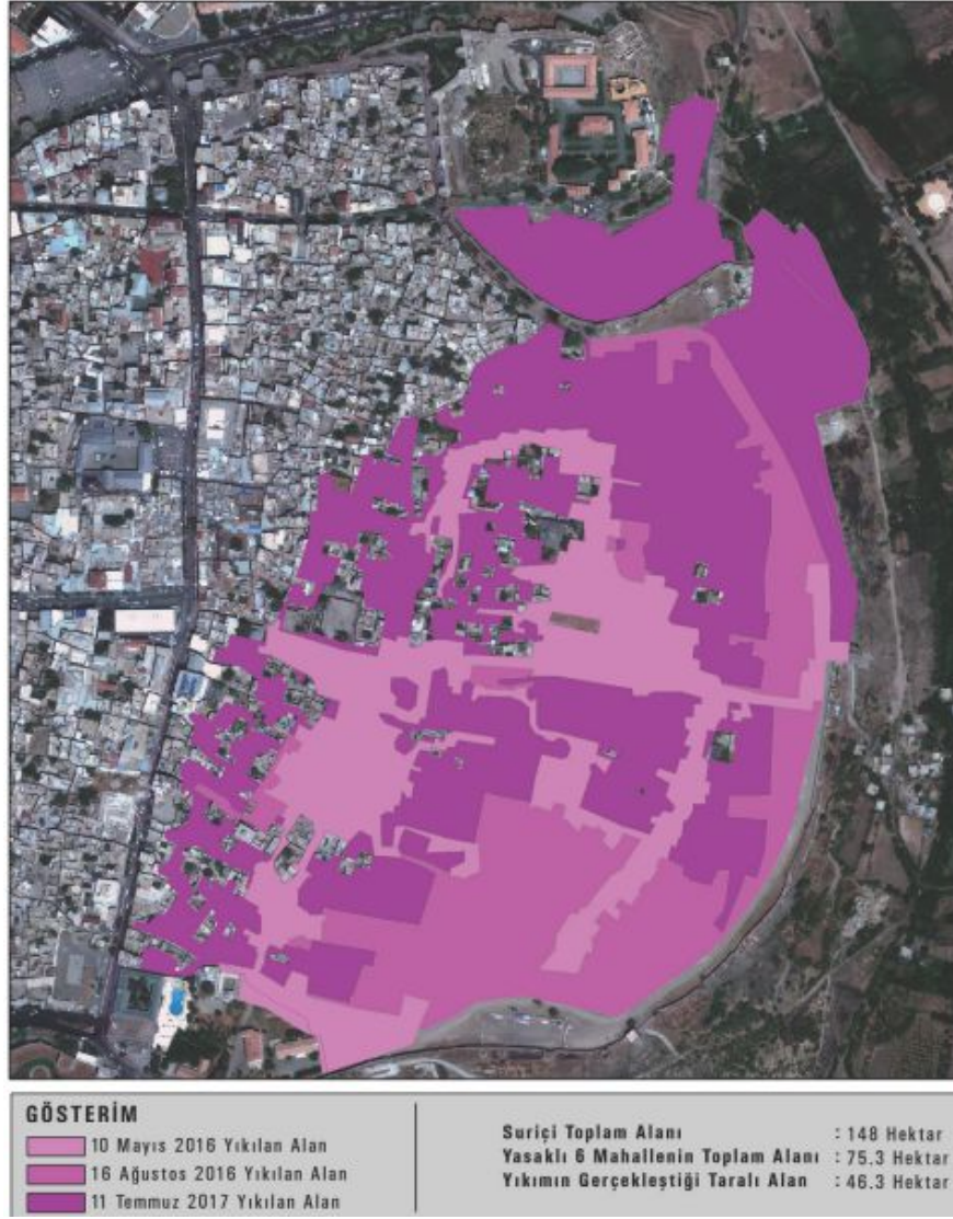
Foto 1: Suriçi'nde 2016-2017 yılı uydu görüntüsünde yıkılan alanlar (TMMOB Diyarbakır Şehir Plancıları Odası Raporu, 2017).