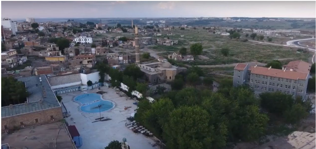
Foto 3: Güneyden Mardinkapı'dan inceleme sahasının görünümü. Savaş mahallesindeki Hüsrev Paşa Camii ve çevresi (Hekim Aydın).

Bu süreç içerisinde bazı önemli yapılar ağır hasar görmüş veya tamamen yıkılmışlardır. Örneğin, Cemal Yılmaz mahallesinde Cumhuriyet İlkokulu ile Hocoaoğlu ve Salos camileri, Fatihpaşa mahallesinde Süleyman Nazif İlkokulu ve Zincirkıran Türbesi, Hasırlı mahallesinde ise Arap Şeyh ve Hacı Ramazan camileri ile Diyarbakır Büyükşehir Belediyesi'ne ait çamaşırhane, bunlar arasında sayılabilir.