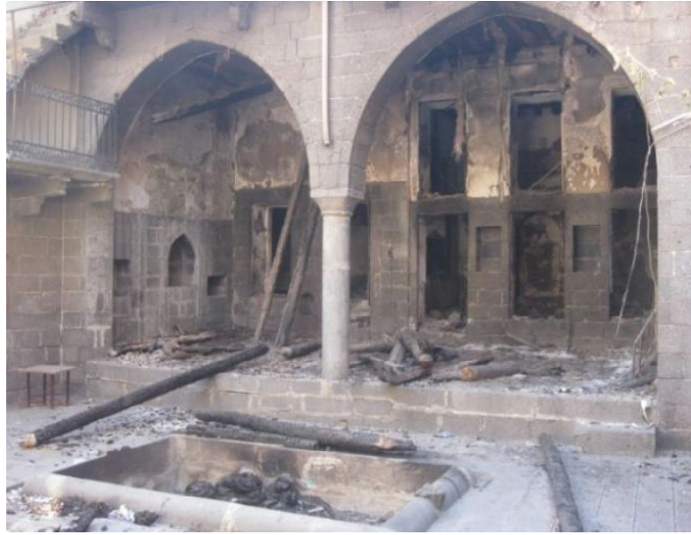
Foto 5: Terör olaylarından hasar gören tescilli bir sivil yapı (Fatihpaşa Mahallesi).

Proje çalışmalarının devam ettiği diğer sahalarda, çalışmalar tamamlandığında yerleşme alanında önemli değişimlerin yaşanması beklenmektedir. Bugün itibarıyla İçkale çalışmaları tamamen bitirilmiştir. Melik Ahmet Caddesi'nin tamamı ile Gazi Caddesi'nin Balıkçılarbaşı-Mardinkapı arasında kalan kesiminde cadde yenileme ve binaların cephe düzenleme çalışmaları tamamlanmıştır. Ulu Cami Meydanı düzenlenerek hizmete girmiştir. Çeşitli noktalarda yer alan cami, kilise, konak gibi tarihi eserlerin restorasyonu devam etmektedir. Alipaşa ve Lalebey mahallelerinde yıkılan gecekonduların yerine inşa edilen geleneksel mimariye uygun binalar teslim aşamasına gelmiştir. Hasırlı, Fatihpaşa ve Cevatpaşa mahallelerindeki binaların inşaa süreci ise devam etmektedir.