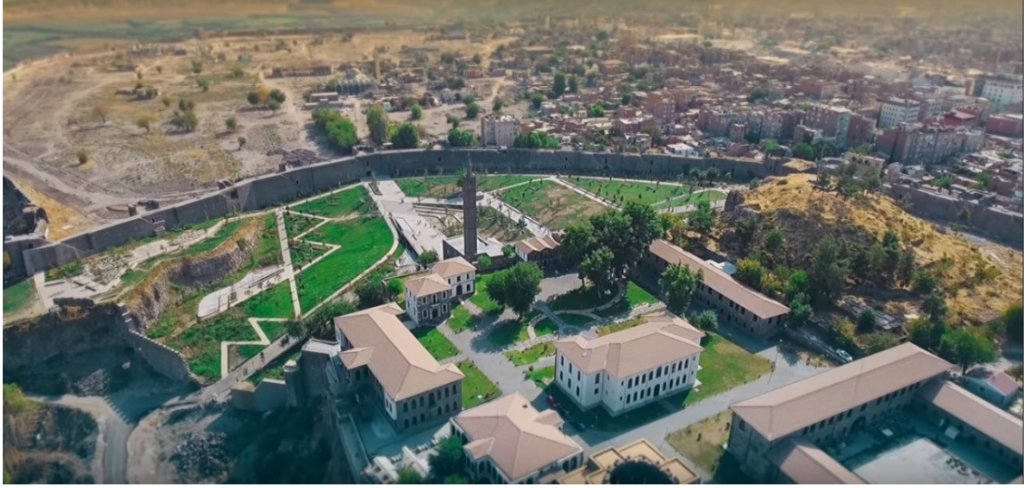
Foto 2: Suriçi'nde İçkale kısmının günümüzdeki düzenlenmiş hali. Arka planda ise inceleme sahasında yıkılan alanlar görünür.

İnceleme sahasındaki mahallelerin yıkılan alan değerleri tablo 4'te verilmiştir. Bu tablo incelendiğinde, fiziki alanının Hasırlı'da % 95'i, Fatihpaşa'da % 93'ü, Cemal Yılmaz'da % 48'i, Savaş'ta % 44'ü, Dabanoğlu'da % 37'si ve Cevatpaşa mahallesinin % 22'si tamamen yıkılmıştır (Foto 3).