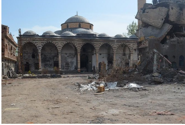
Foto 4: Fatihpaşa mahallesinde terör olaylarından büyük hasar gören Kurşunlu Camii (1520). Günümüzde cami restore edilmiş ve ibadete açılmıştır.

Yıkılmayan ancak önemli hasar gören yapılar ise şunlardır: Cemal Yılmaz Mahallesi'nde Hüsrev Paşa Camisi ve Protestan Kilisesi, Dabanoğlu Mahallesi'nde Nasuh Paşa Cami, Şeyhzadeler Konağı ve Yavuz Selim İlkokulu, Fatihpaşa Mahallesi'nde Kurşunlu Cami (Foto 4), Esmâ Ocak Evi ve Yenikapı Sağlık Ocağı, Hasırlı Mahallesi'nde Ermeni Katolik Kilisesi, Mehmet Uzun Evi ve Paşa Hamamı, Savaş Mahallesi'nde Şeyh Mutahhar Cami, Dört Ayaklı Minare, Hacı Hamit Cami, Surp Giragos Ermeni Kilisesi, Marpetyun Keldani Kilisesi ve SODES Kreşi ile Ziya Gökalp Mahallesi'nde Dengbejler Evi hasar gören önemli yapılardır (Foto 5).