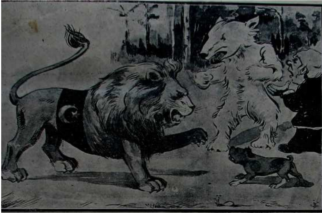
Numara 18 sayfa 4