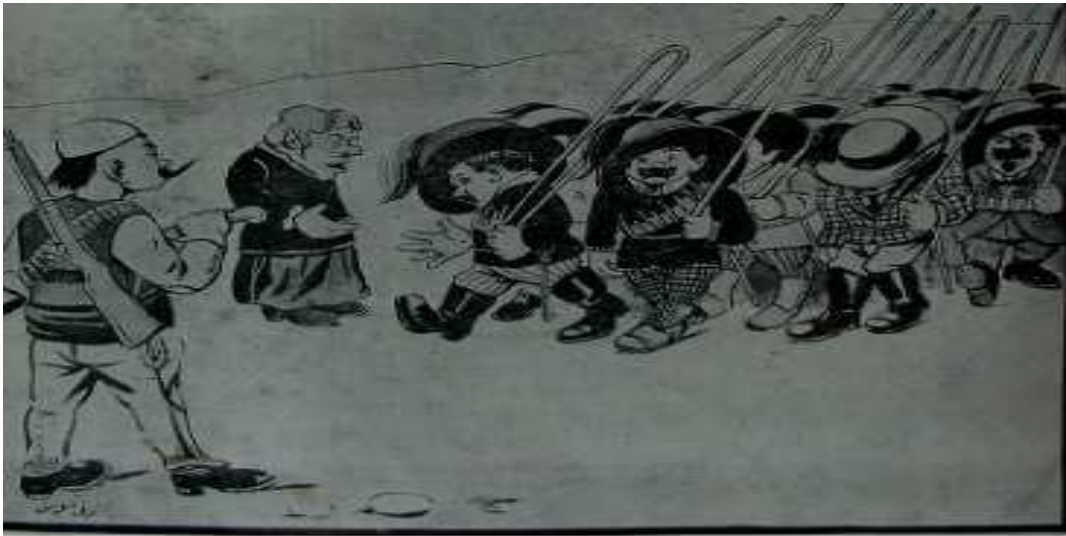
Numara 7 sayfa 1