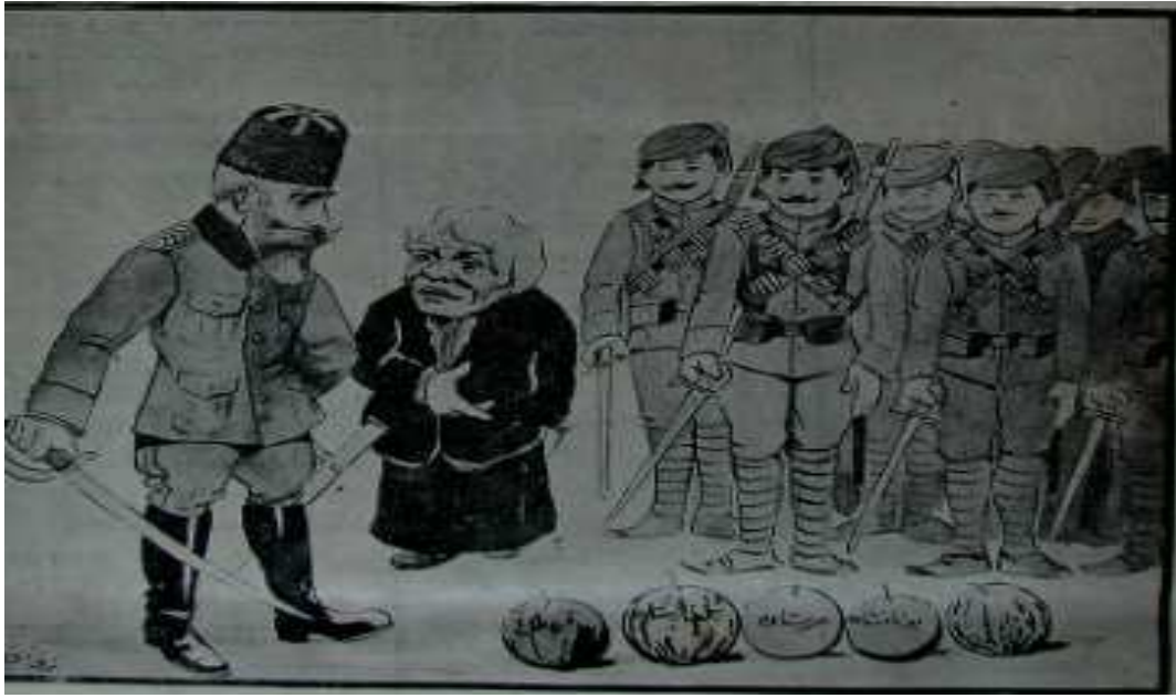
Numara 11 sayfa 1