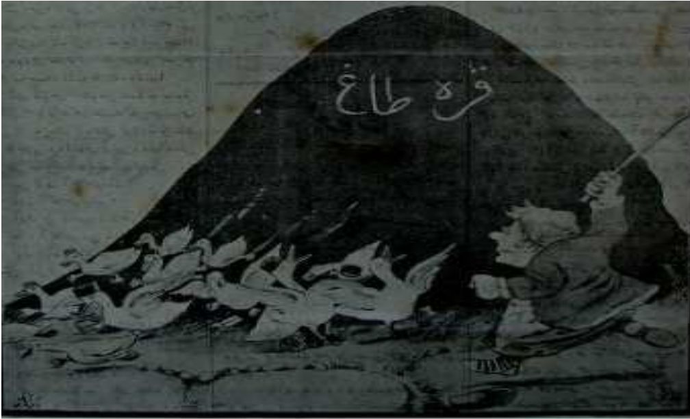
Numara 2 sayfa1