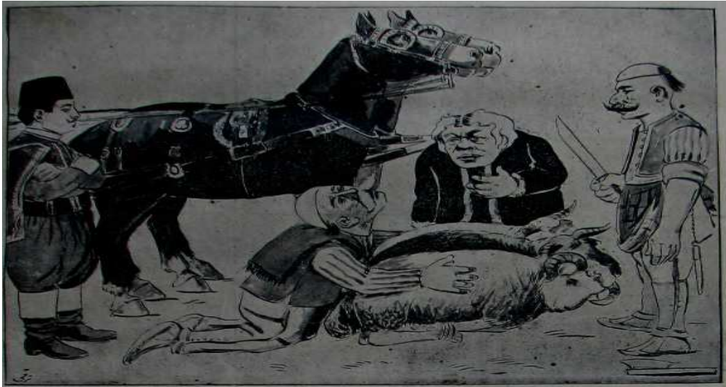
Numara 24 sayfa 4