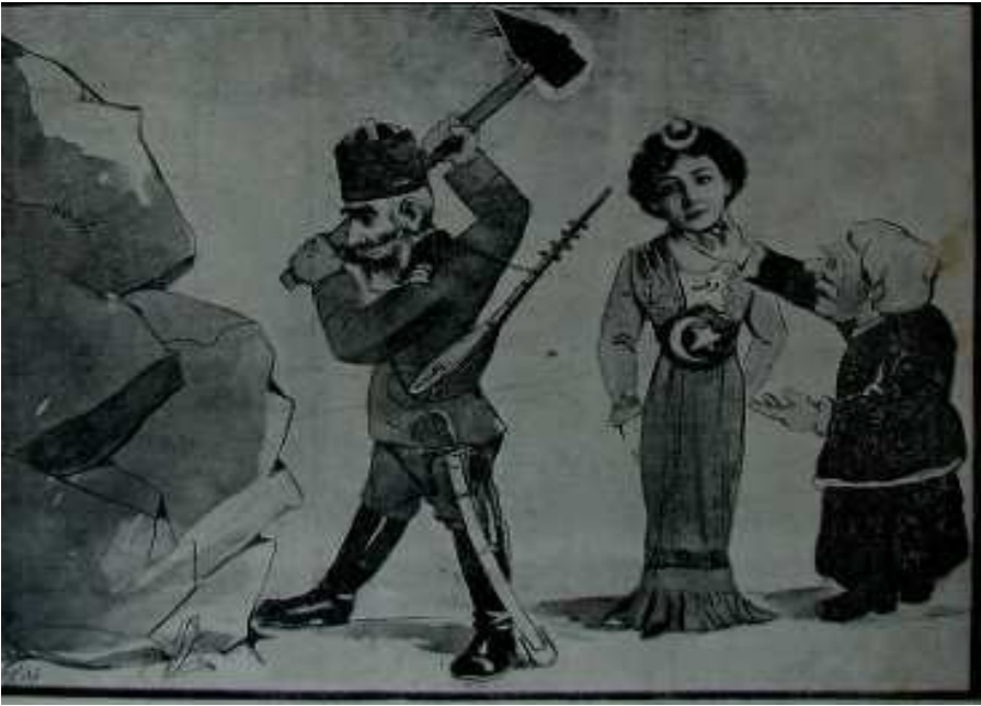
Numara10 sayfa 1